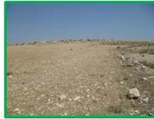
Zona B. Ayoó de Vidriales