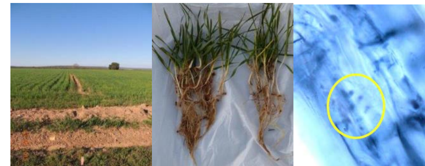
Continuous monitoring of soil, plants and roots