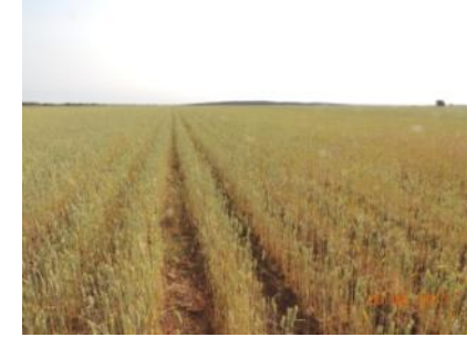
Soil improvement and root development